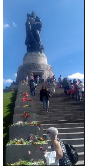
Най-големият съветски паметник в Германия. Намира се близо до Трептов парк в Източен Берлин.

По време на Третия райх в концентрационните лагери се са убивани само евреи, синти и рома, а също и немци хомосексуалисти. Това е паметник, издигнат в памет на хомосексуалистите и на хора от третия пол, убити по време на фашистката диктатура.