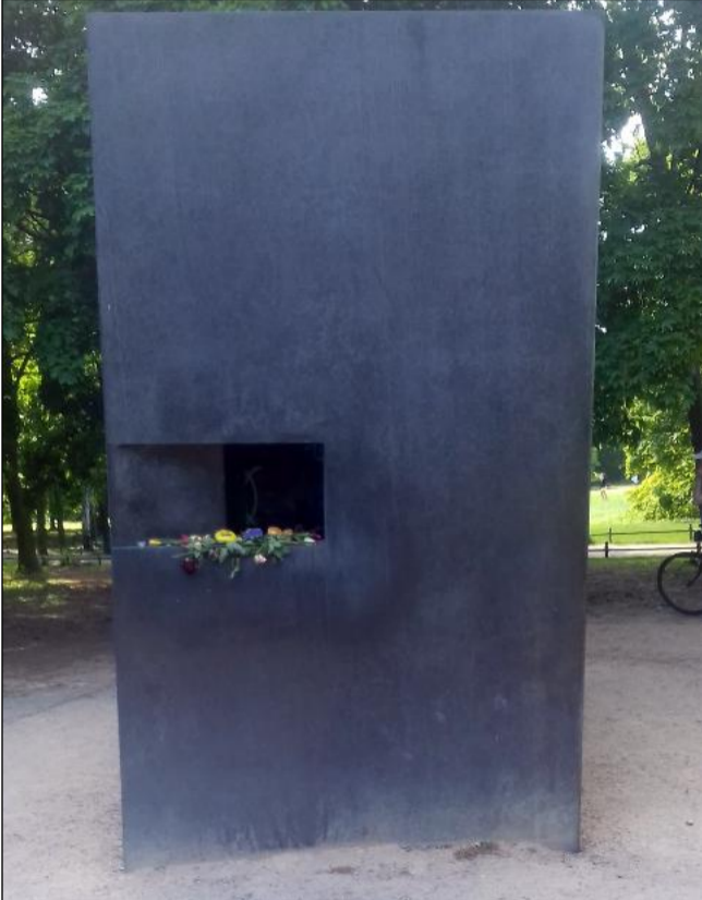
Монумент, в чест на убитите евреи, по време на Третия Райх.

Факт е, че без ден на победата нямаше да има Ден на Европа. Втората световна война показа, че една голяма война не води до нищо добро, а до смърт, страдания, мизерия и нищета.