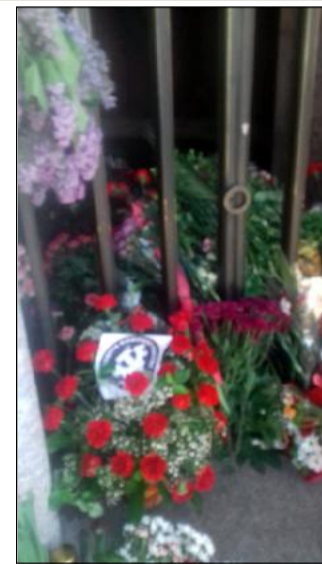
Море от цветя. Венци са положени от президента, канцлера, президента на Бундестага и от много посолства. Венец от българското посолство не видях на монументите.