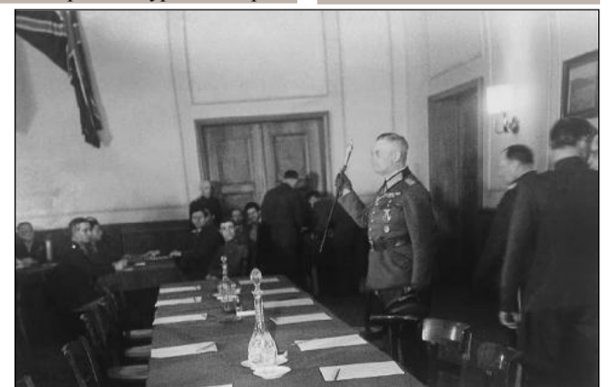
При пристигането на германската делегация начело с фелдмаршал Кайтел никой от присъстващите офицери от страна на съюзниците не става и не отговаря на военния поздрав (вдигнатия жезъл).