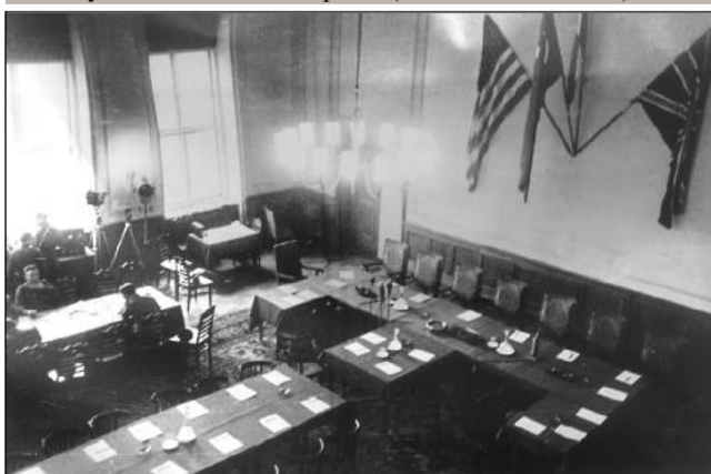
Голямата зала на офицерското казино на 8. май 1945 г. Фелдмаршал Кайтел е поставен умишлено в ъгъла на главната маса при подписването.