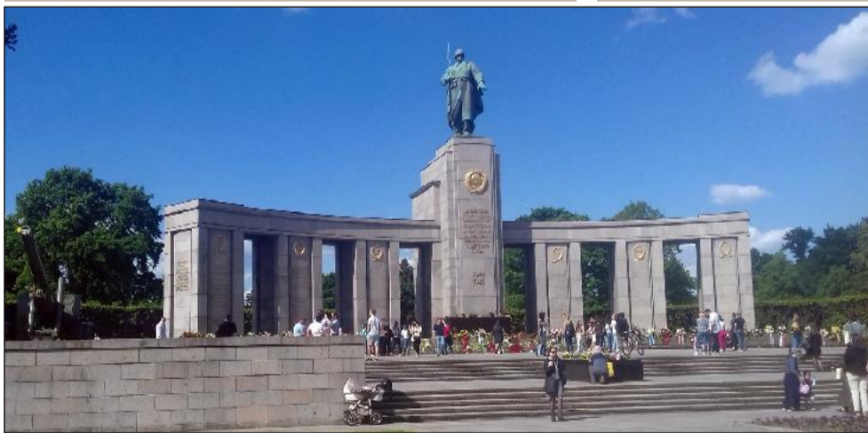
Монумент в Западен Берлин (Английската зона) в близост до Бранденбургската врата

Ратифицирането на капитулацията на Германия в Берлин-Карлсхорст на 8.05.1945 година. Безусловната капитулация на германския Вермахт беше вписана в декларация от Вермахта в края на Втората световна война. Тя съдържа ангажимент за прекратяване на боевете срещу съюзническите сили. Капитулацията е подписана след неуспешни опити на германската страна да преговаря на 6 май 1945 г. в нощта срещу 7.05.1945 г. във Върховния щаб на Съюзните експедиционни сили в Реймс и влиза в сила на 8 май. Тя бележи края на военните действия между националсоциалистическия германски райх и съюзниците. Ратифицирането е било договорено, за да се гарантира, че капитулацията ще бъде подписана от главнокомандващия вермахта Вилхелм Кайтел и от началниците на германския флот и ВВС. Германската делегация, пристигнала от Фленсбург, подписва капитулацията на 8/9 май в голямата зала на офицерското казино на училището за сапъори в Берлин-Карлсхорст. В Берлин-Карлсхорст се е намирал и щабът на Червената армия.