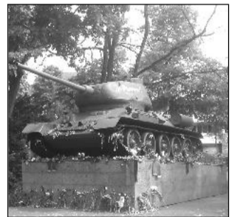
Фоторепортаж и историческа разходка: ДИМИТЪР СТАНКОВ