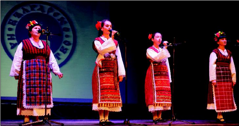
Семеен квартет "Чуфарличевци" - с. Селишгло (Холмско), Р. Украйна - II място