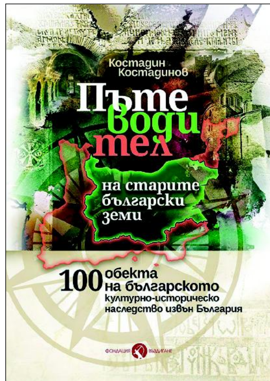
100 обекта на българското културно-историческо наследство извън България