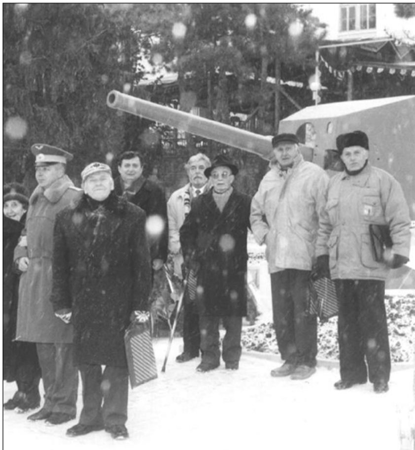
На 14 декември от 14.00 ч. 2001 г. в Балчик бе тържественото откриване на Паметника на войската храброст и морската слава.

ната национална болка. Те самите са гинали при Одрин, Чаталджа и Калиманци, за да донесат свобода на сънародниците от други български области. Но се завръщат в погазени родни огнища. Това обяснява как, въпреки колебанията на политици и военни пред войната, на два или три фронта, духът на освободителната Трета армия е изключително висок. Състрадавайки на прииждащите измъчени бежанци, войниците едва са удържани от своите командири да не се втурнат по-рано от деня на началото. Яхнал дорест кон, командващият генерал Стефан Тошев пропуска устремите напред колони с пламенни думи. Надарен с прочувствено слово, той олицетворява победоносната увереност. „Юнаци, ще ги бием. Ще ги смачкаме!“ В отговор: гръм-