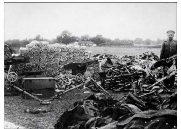
В знаменитата Тутраканска операция, българите изправят 3-та българска армия в състав – 4-та преславска пехотна дивизия, 1-ва бригада от 1-ва софийска дивизия, Дунавският българо-германски отряд и прирадените им части под общото командване на началника на 4-та преславска дивизия генерал-майор Пантелей Киселов с численост 55 000 души, 132 оръдия и 53 картечници. Вестник "Пряпорец" от 9 септември 1916 г.: "Устремът, с който са се втурнали през границата срещу новия враг, е дивен. Той се явява не само като чувство за борба и ламтеж към победи и слава, но и като желание за отплата... Тъй се обяснява устремът, с който днес българските войски се носят по равнините, които са били люлката на старото българско царство". Николай ИНГИЛИЗОВ