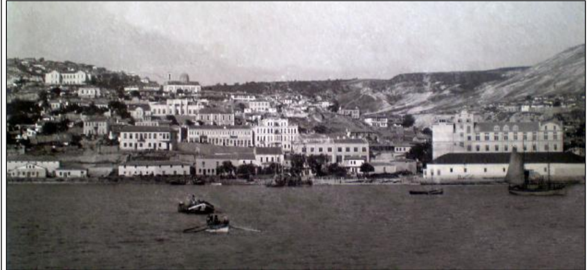
Изглед от Балчик в началото на XX век.