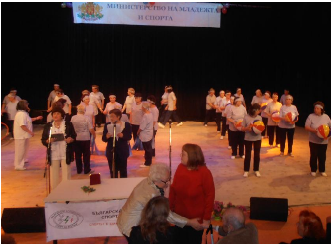
Съчетанието с лечебни упражнения „Морски емоции“ се хареса най-много на гала състезанието в НДК София, където клуб „Здравец“ Балчик бе аплодиран от всички.