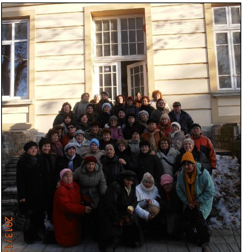
Клуб „Здравец“ Балчик гостуваха на пенсионерския клуб в гр. Полски Тръмбеш, където разгледаха забележителностите на градчето и останаха приятно изненадани от прекрасното посрещане.

Зала „Люмиер“ на НДК София отново беше домакин на гала състезание, станало традиционно за десетте най-добри отбори по гимнастика от Асоциацията „Спорт за всички“. Балчишките гимнастички – ветеранки бяха поканени /при това първи в списъка/ да участват в този спектакъл на красотата, волята и упоритостта на хората от Третата възраст.