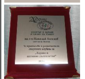
Грамота за кмета