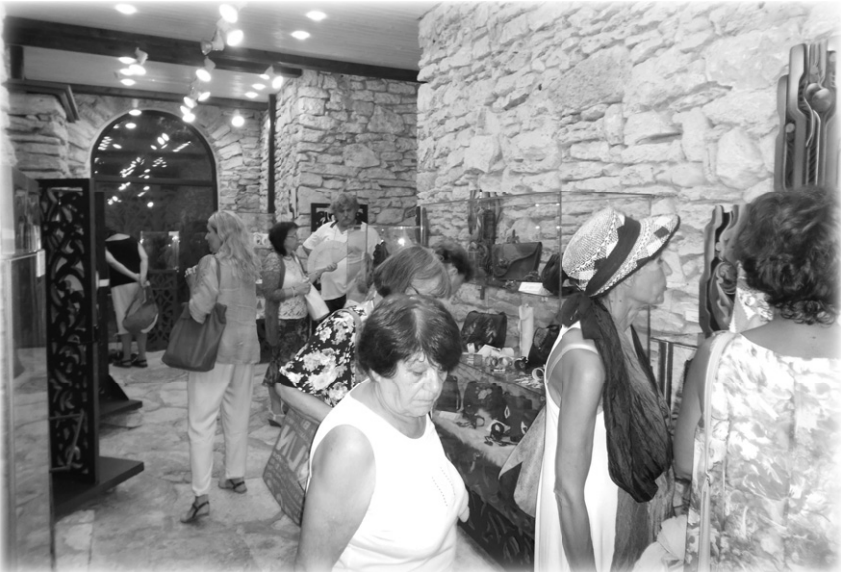
Изложба от кожени творби на семейство Фотеви.