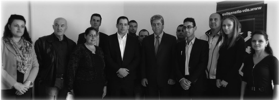
На 21 септември 2016 г. лидерът на Партия „АБВ“ Георги Първанов се срещна с кандидатите за съветници от Балчик, които ще премерят сили с другите партии и коалиции, поради провеждането наново на избори за местен парламент на 2 октомври.