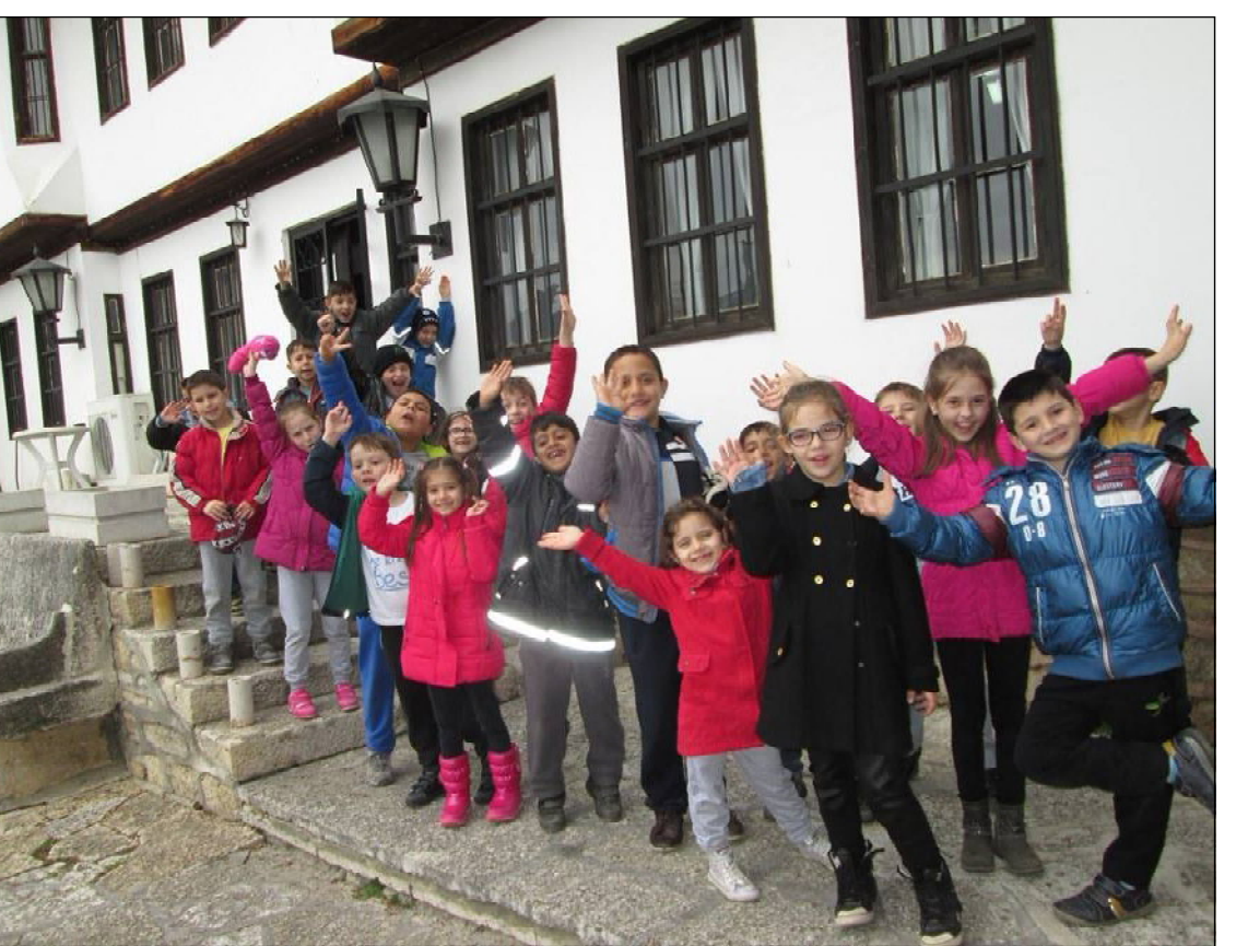
Учениците от 1 б клас, ОУ "Антим I" Балчик, посетиха Етнографския музей и Взаимното училище в Балчик.