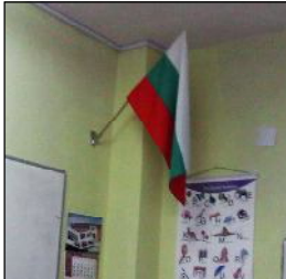
Сдружение "Кибела" гр. Балчик по случай Националния празник -

Трети март, ни дариха 27 български национални флага.