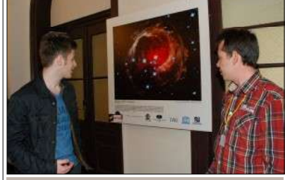
На конференцията за Хъбъл

ността на монетарната (Евксес и Андreas) от съседния Дионисополис.