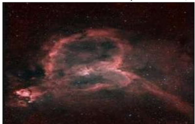
Хъбъл заснел Града на Господ

ново насочили Хъбъл към мястото, на което засенял привизията град. Новите снимки били с още по-добър резолюция и там ясно се извидят въпросните мистерии-розен град. Но наличният на въпросния град не е същото, което учените от НАСА установявали. Този град се намирал в самия център на Волелнагата - мястото, което започнал стар. Голям взрив. Итерос проявил дори Свети папа Йоан Павел Втори.