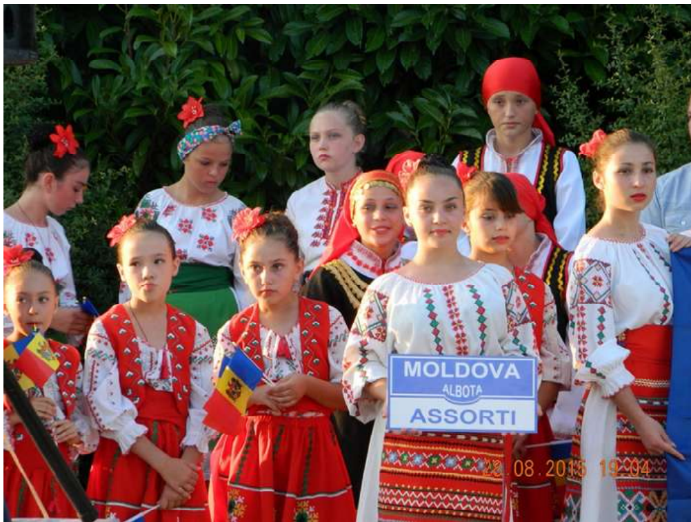
Бесарабските българчета от с. Албота, Молдова, бяха класирани на първо място за автентичен танцов фолклор на Първия международен форум „Българско наследство“, Балчик 2015 г.

През тази година, през есеп август, в Балчик се проведе Първият международен форум „Българско наследство“, под егидата на д-р Румяна Малчева Ангелова, носител на званието „Общественик на 2013 г.“