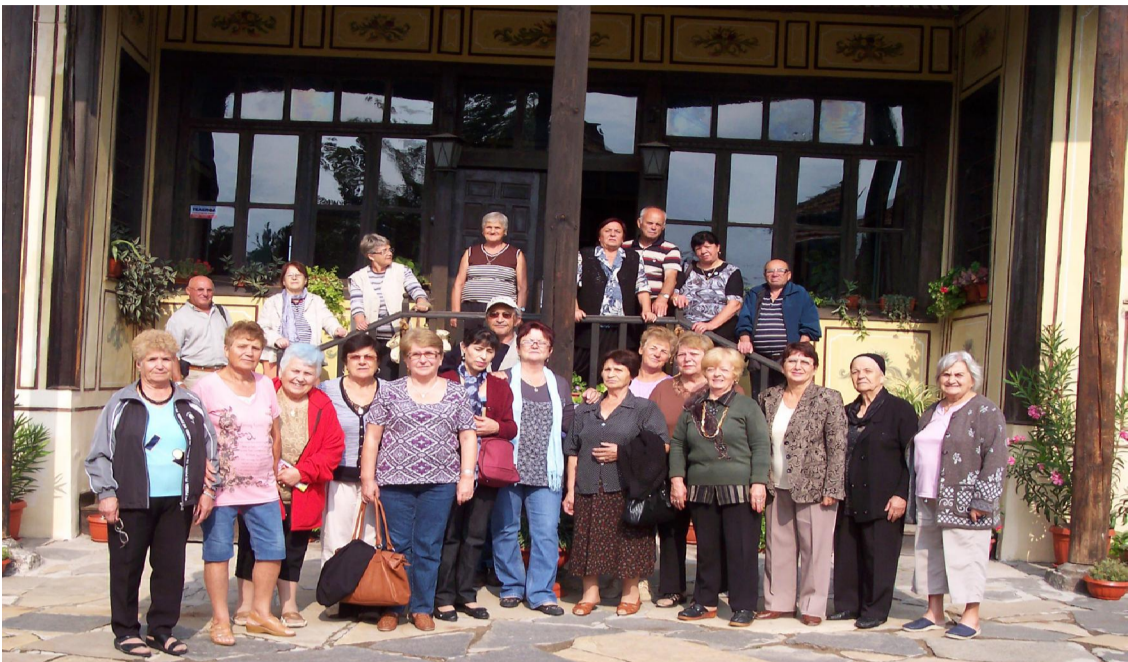
Клуб "Здраве" на посещение в Чирпан.