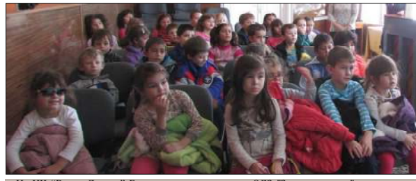
На НЧ "Васил Левски" Балчик гостуваха деца от ОДЗ "Знаме на мира" и ученици от вторите класове на ОУ "Антим I". На децата от детската градина представихме мултимедийна презентация за дивите и домашни животни. За учениците презентацията беше посветена на 1 ноември - Ден на народните будители.