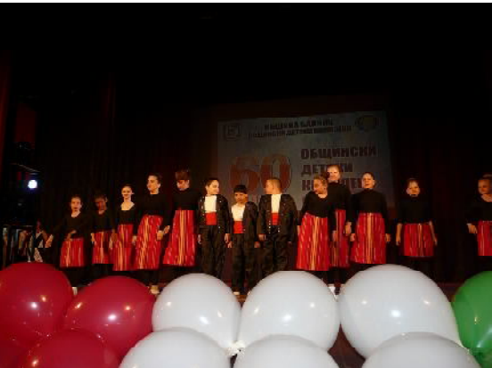
Във вихъра на украинските танци - ТФ "Ритъм" е вече 20 години.