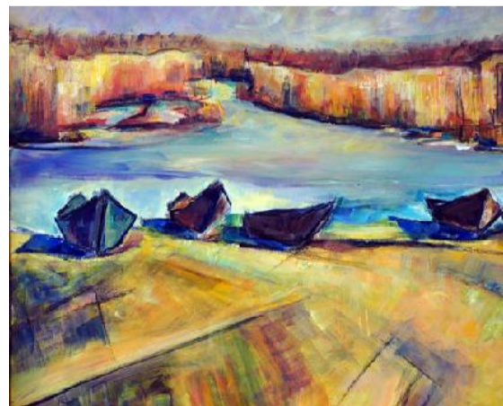
"Добруджански бряг" Флорентин Сърбу, р-л на Школа по изобразит. изкуство в гр. Констанца

Добруджа - специфичен колорит и пространство" представиха живописци от