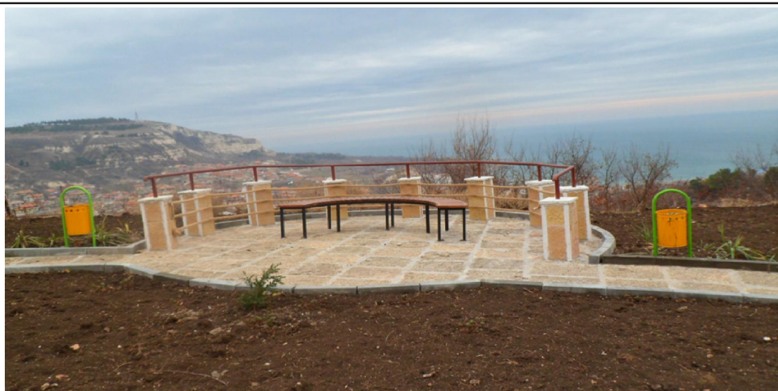
Двете снимки показват отлично осъщественият проект на Общината за детски и панорамен кът. За съжаление вандалите изпочупиха люлките и лодката, а катастрофирала е едната от лодките.