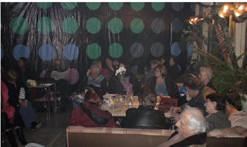
Среща на литературните клубове на Балчик и Каварна в кафене „Интелигент“.

С приповдигнато коледно настроение, в приятелска атмосфера, на 13 декември м.г. се състоя творческо-приятелска среща между членовете на балчишкия литературен клуб „Й. Кръчмаров“, с ръководител Н. Мирчев и техните братя и сестри по перо