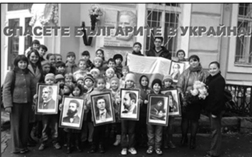
Наши сънародници въстанаха срещу насилствената мобилизация

НЕЗАБАВНО ВЪВЕЖДАНЕ НА ОБЕЩАНИЯ ОЩЕ ПРЕДИ МЕСЕЦИ БЕЗВИЗОВ РЕЖИМ С УКРАЙНА!