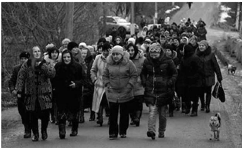
Бесарабските българи от село Нови Троян, Одеска област (Украйна) протестирали срещу мобилизацията.