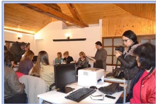
КИЦ във вила "Арка" е изграден в Двореца - Балчик