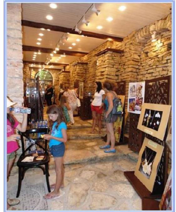
Арт галерия "Тунела" в балчишкия дворец