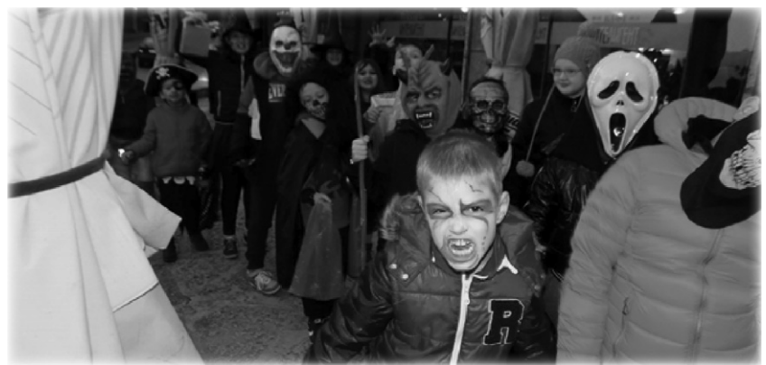
Хелоуин парад на учениците от Училище „Биг Бен“ Балчик.