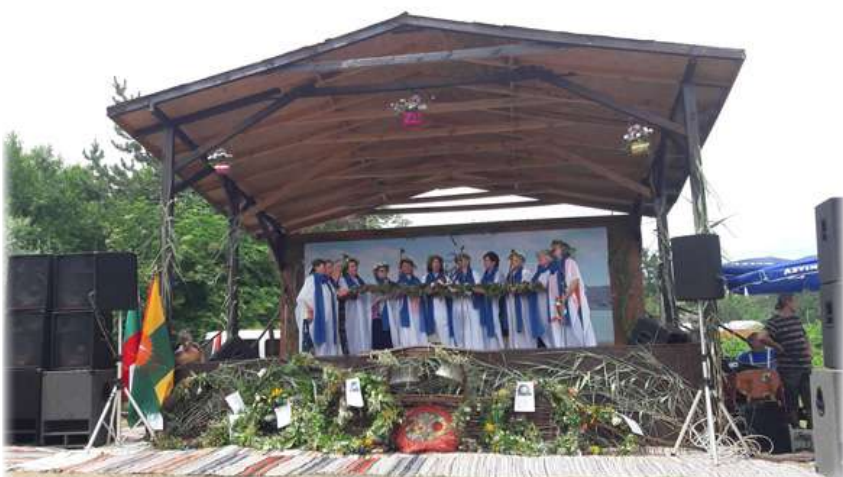
ПГ „Неспокойни вълни“ към Клуб „Хинап“ в Балчик с Еньовденски венец в с.Красен.

„Добруджа!... Два тона има в пейзажа: синята ведрина на небето и зелената на нивите... От цялото поле иде радостта на щастливо материнство, благодатният плод зрее сред блясъка на пищната красота на цялата природа... Душата се пълни с възторг от могъщата хубост на земята!“