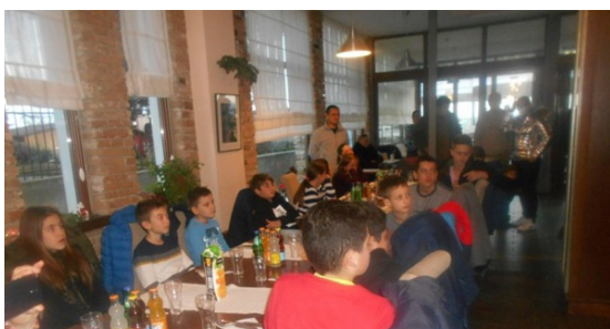
Деца от Морски клуб „Балчик“ се радват на отчетените на специално събрание техни резултати.