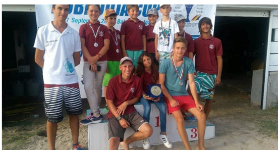
Доволни от представянето си на регатата „Добруджа къп“ през септември 2017 г.

Работата на треньорите, подкрепяни от Стоян