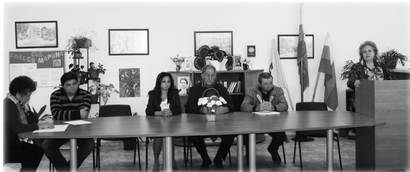
Деловият президиум на отчетното събрание на Дружеството.