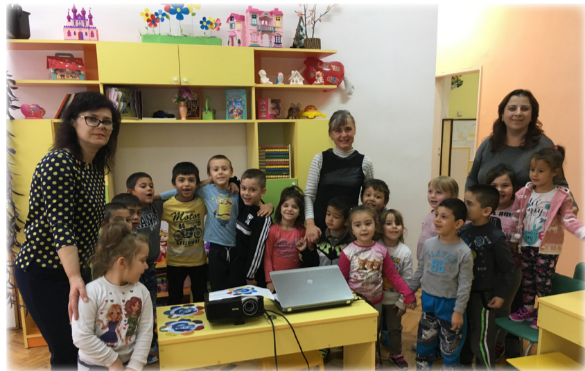
Мероприятие на библиотеката на НЧ „Паисий Хилендарски 1870“ Балчик с деца от с.Сенокос.

На 16 ноември, заедно с децата от ЦДГ „Мир“, отбелязахме Международния ден на толерантността. Представихме презентация, чрез която дадохме определение за толерантност, разяснихме какво означава да си толерантен и как да го постигнем.