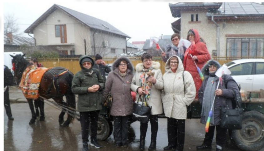
И ние от сдружение „Българско наследство“ - Балчик на конската талига на „Тудорица“ в румънския град Търговище.