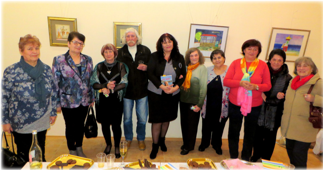
Участници в Литературната вечер "Любов, налеј ми чаша вино" в Каварна на 12 февруари 2020 г.

На 12.02. 2020г. се състоя вечер на поезията и виното „Любов, налеј ми чаша вино“. Организатори на събитието бяха НЧ „Съгласие – 1890“ – гр. Каварна и ХГ „Христо Градечлиев“. Залата в галерията се оказа тясна да побере всички любители на красивата и стойностна поезия, както и ценителите на хубавото вино.