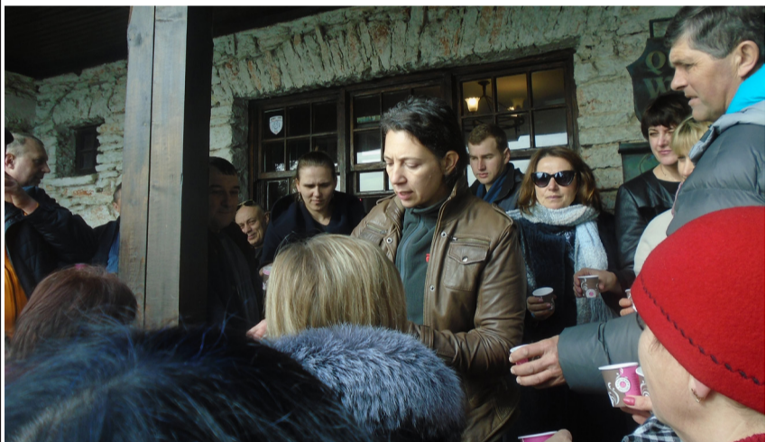
Украински фермери посетиха Кралската Винарна в „Двореца“ и се възхитиха при дегустацията на прекрасното вино, макар и в Украйна да има хубави вина.