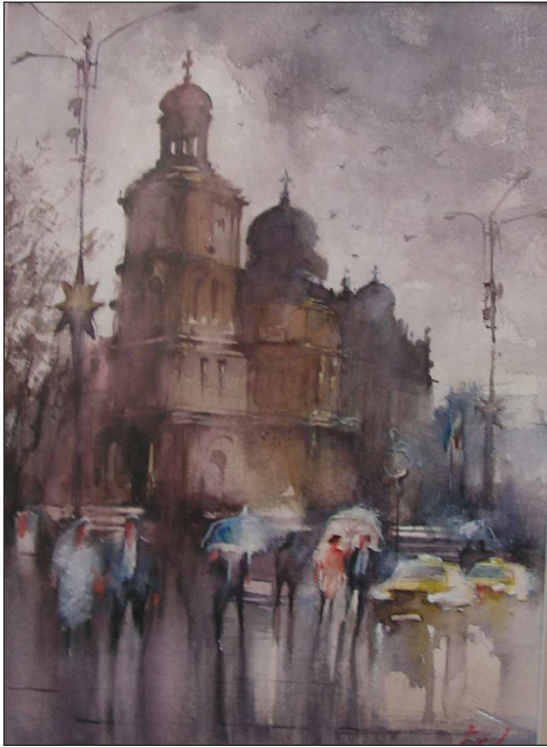
Валентин Балеv - Катедрален храм - Варна