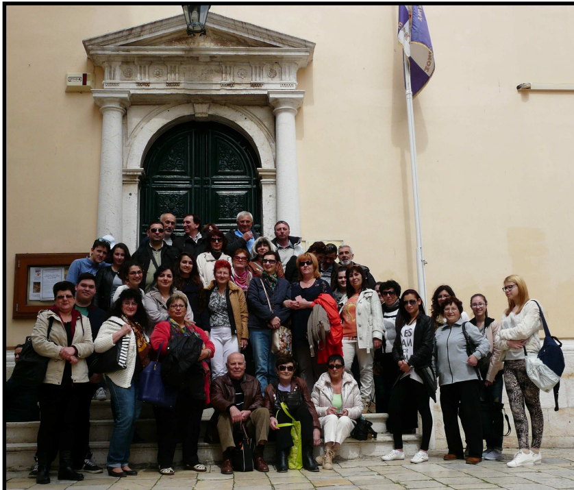
Доволни туристи от Балчик, Добрич и Варна пред православната църква "Св. Спиридон" в град Корфу, Гърция, организирани от варненската фирма "Аркаиин Тур".

Справки и записвания на тел. 0899 65 52 49 или 0579 728 09 Маруся Костова