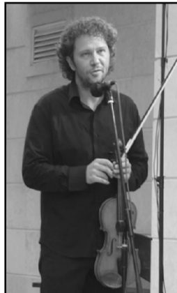
Маестро Пантелеев, добре дошли отново в нашия град, защото според мен, благодарение на Вас в Балчик се появи още едно богатство. Доволен ли сте от посрещането и от кого?

Благодаря, не само съм доволен и радостен, а и превъзбуден от щастие, което завладя сърцето ми. Миналата година, когато си отивах от Балчик лято ми обеща, че следващото, когато дойда отново, ще бъде по-хубаво от предното. Така стана и в действителност. Първо трябва да благодаря на Община Балчик; Концертна агенция „Музика арт“; кк „Албена“ АД; радио Добруджа; НЧ „Паисий Хилендарски“ – Балчик; хотел „Мистрал“ (защо обичали Странджата, защото давал манджата – б.а.). И на нейно величество публиката.