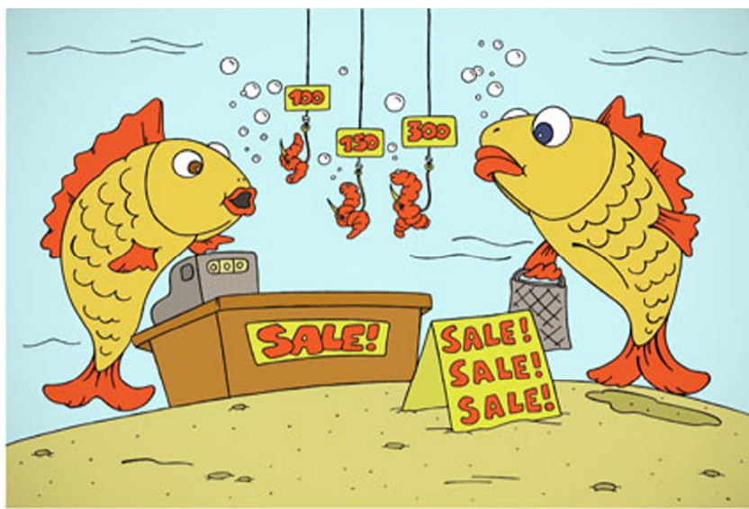
Андрей Жигадло - Русия