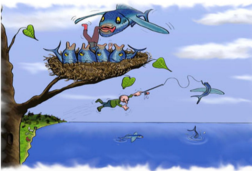
Бернд Диел - Германия