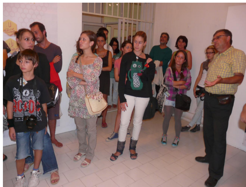
Откриване на изложба „Дизайн за хората“ и предложение за туристическа информационна система в Балчик

Презентацията включва и система за улеснено ориентиране на гостите на града, на туристите и ценителите на културата, чрез отбелязване на ключови обекти с информационни пунктове, табели и пътепоказатели. Проектът за сувенири показва идейно предложение за експонати от екологични материали, например изработени от оцветен с акрил гипс, без вредно влияние, опаковки от оризова хартия и др. Интересни като проект са и изображенията на забележителностите на Балчик – двореца, кактусовата градина, морски клуб и др., представени стилизирано в шестоъгълна мрежа, символизираща пчелна пита в жълтомеден цвят. Тук идеята е изведена от сричката „бал“, което в