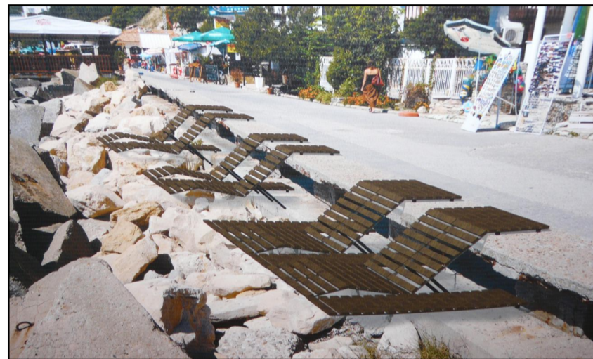
Проект за модерен тип пейки по крайбрежната алея.

превод от турски е мед. Младите дизайнери не са пропуснали и малките жители – има интересни проекти за детски площадки за деца от 10 до 12 год., особено впечатляват тези, които стимулират развитието и укрепването на опорно-двигателната система на подрастващите. Много интересни хрумвания са реализирани в проектите за информационни пунктове. Такава е концепцията за плаката, спечелил конкурса за градския дизайн, на фестивала с програмата и богатата информация за него. Представен е и проект за система за сигнализация на обекти от ма-