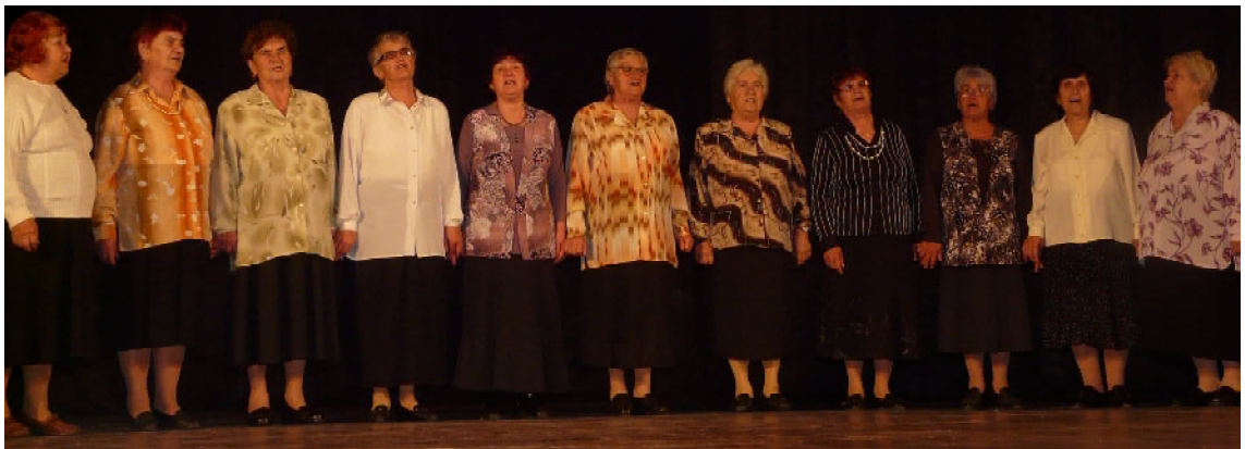
Хор към Пенсионерски клуб "Втора младост" в кв. Левски, Балчик