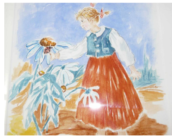
Айла Койвисто - "Момиче с маргарити"