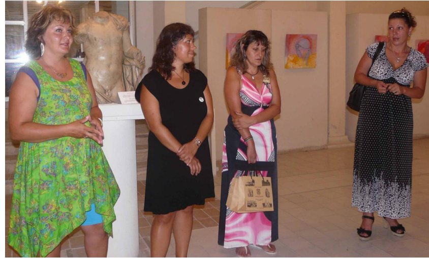
Откриване на финландската изложба „Щастие“ на 3 август 2012

С методите и стила на класиката са изградени пейзажите на Ритва Линдфорс; с послание към детската чистота и не принуденост се отличават акварелите на Айла