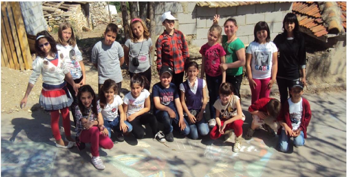
Честит празник, уважаеми ученици, учители и родители!

ОУ „Св. св. Кирил и Методий“ е първото училище в града, което развива вековната традиция да славим и почитаме знанието, науката и духовността, като значима ценност за българския народ.