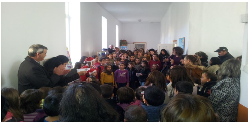
„Над смълчаните полета“, в изпълнение на децата от ОДК подсили коледното настроение.

На 12 декември 2012 г. от 14:00 ч. се проведе официалната изложба на творбите в ОДК и церемония по награждаване на отличените участници. Журито бе доста затруднено да класира многобройните творби, като в крайна сметка отличи 68 - с призови и поощрителни награди. Официален гост