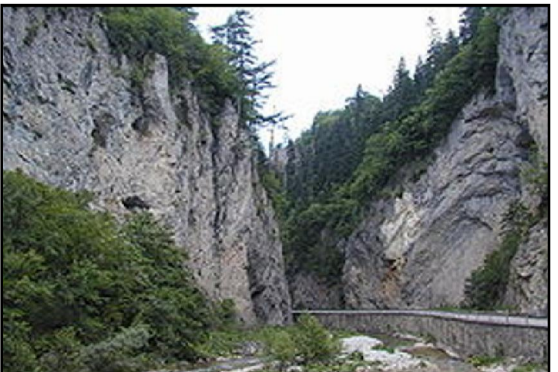
Изглед от Триградското ждрело

най-големият подземен водопад на Балканите, пещерата дава начало на различни легенди от времето на траките. Именно тук Орфей се спуска в подземното царство на Хадес, за да спаси любимата си Евридика. Изживяването е