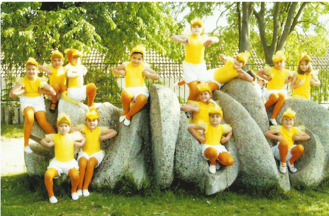
Най - малките патета от балетната школа на "Данс"