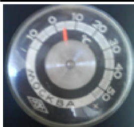
ТФ „Ритъм“ репетира при температура 5 градуса и кален физкултурен салон