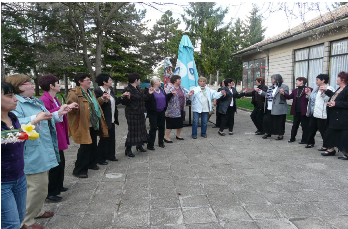
Хинапско хоро в село Септемврийци