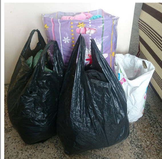
Още едно много мило дарение на бебешки дрешки. Този път то идва от град

Балчик. Лично Цветелина Ангелова ми го предаде днес. Цвети е майка на две