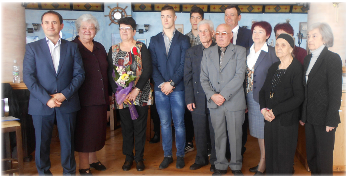
“Обществениците на 2017 година”