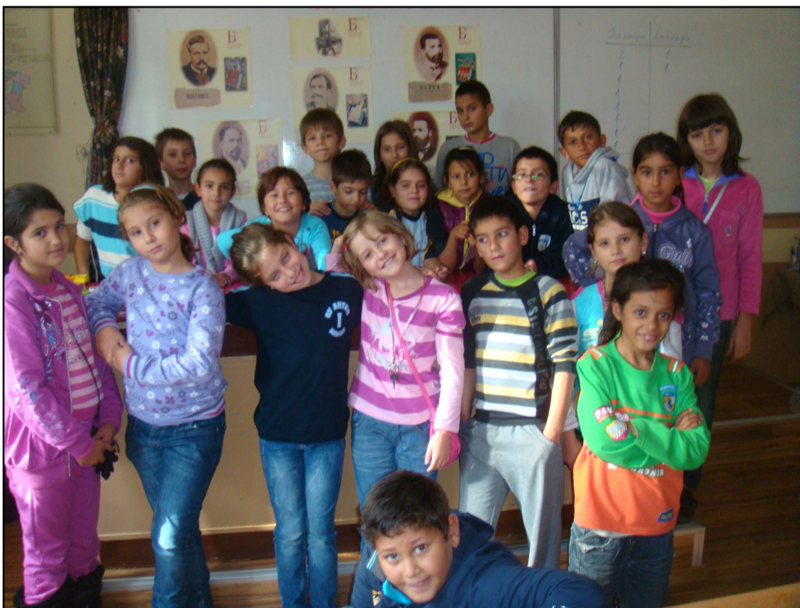
Ден на будителите в ШБ клас на ОУ „Антим I”