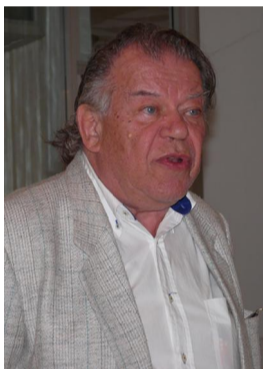
Акад. К. Косев

В празния 21 септември в ХГ Балчик се състоя литературно-музикален спектакъл с участието на акад. Константин Косев, Стоян Райчевски, Петър Маринков, Панко Анчев и разбира се с главния организатор на Националните културни празници „Албена 2013“ издателя Иван Гранитски. Много бе приятно музикалното начало и изпълнението на два валса от Шостакович и чардаш от Монти, превъплътени с пианото на Младен Тасков и цигулката на Цветан Козлев.