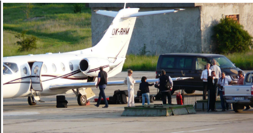
Слизат първите 6 пасажери за голф турнир край Балчик