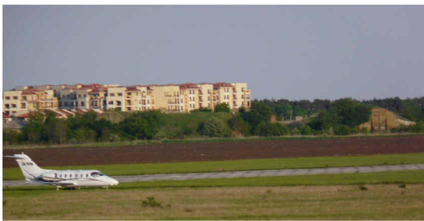
Приземяващият се чешки първи граждански самолет на летище Балчик.

По-малко от два месеца след назначаването на г-н Красимир Костов /наш съгражданин, о.з. майор, бивш началник щаб в авиотехническата база/ за „Ръководител на експлоатационно звено-летище Балчик“, първият международен полет на граждански самолет с кацане на летището вече е факт. Реактивен бизнес-самолет "Бийджет-400" с чешка регистрация ОК-RHM, в 19,07ч. на 3-ти май докосна балчишката писта с пътници на борда. Обратният полет до чешката столица Прага бе осъществен на 7-ми май, понеделник, от екипаж с командир Владислав Прокоп. Един от шестимата чешки голфъри, пристигнали в „Грейшънс клифс" е начело в провेलия се голф турнир.