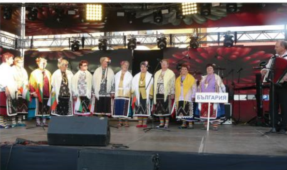
Румънският фолклорен ансамбъл „Цара Вранчей“ от град Фокшани изнесе самостоятелен концерт, с който бе открит тържествено IV Международен форум „Българско наследство“ в Балчик, България, на 24 август 2018 г.

Manager, Ansamblul folcloric "ȚARA VRANCEI" FOCȘANI- ROMÂNIA