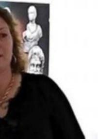
Откриване на изложбата във В.Търново

Българското туристическо дружество „Албена“ АД сключи договор за франчайз с международната хотелска верига MARITIM за петзвездния комплекс „Парадайз Блу Хотел & Спа“, собщи компанията чрез БФБ АД. Договорът за франчайз е от 15 октомври 2018 г., като повече подробности не се съобщават. MARITIM е основана през 1969 г. и към момента оперира 48 хотела за почивка и бизнес в Европа и света - в страни като Германия (33 хотела), Малта (един хотел), Испания (два), Турция (два), Египет (един), Мавриций (един) и Китай (три). „Брандът MARITIM е ем-