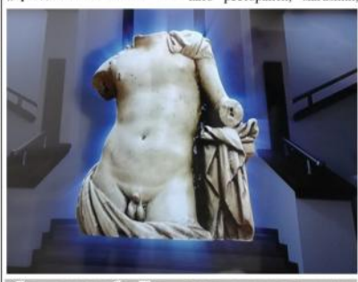
Статуята на бог Дионис, промоционален клип за региона Балчик - Мангалия

може да взема по-висок наем за ресторантите, магазините и другите си обекти. Разбира се, че компанията не може да се грижи сама за осигуряване на вътрешна конкуренция и разнообразие между десетките собствени хотели и не може, сама по себе си, да осигури разнообразие на концепциите. Големият въпрос е с колко бързи стъпки „Албена“ АД ще върви по пътя на разнообразието, диверсификацията и повишаване на новото, защото има още над 30 обекта в курорта, много от които имат нужда от освежаване на кон-