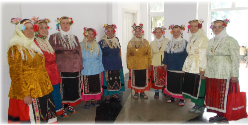
Фолклорна група от с.Стожер, Н.Ч. „Свобода“ - домакин на една от сцените на събора в Добричка област.