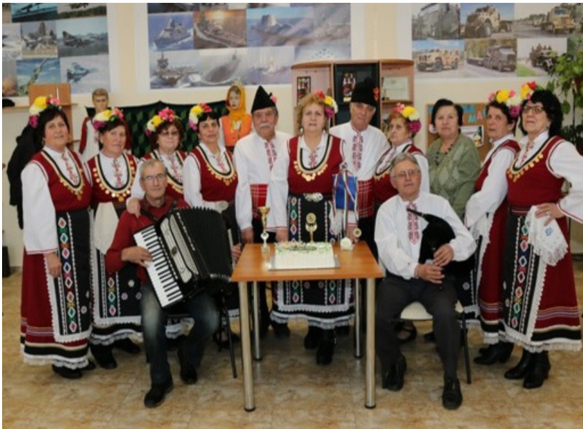
Певческата група „Росна китка“ отбелязва тържествено своята 5-годишнина.

В навечерието на Коледа, на 23 декември 2017 г., певческа група „Росна китка“ чества 5-годишен юбилей и отчете множество участия в : градските и общински празненства, в национални и международни фестивали /Румъния и Молдова/.