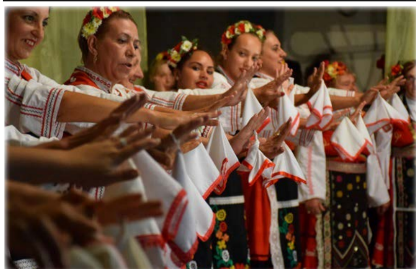
С.Гурково – в Павел Баня на празника на Розата и минералната вода

Делегацията е имала срещи с ръководства на водещи компании, с представители на държавни и местни институции в Китай.