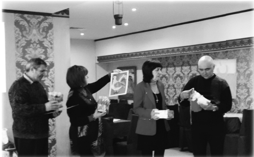
Размяна на подаръци по време на тържеството на клубовете към СИБ от Балчик, Шабла и Добрич.

Членове на СИБ от Балчик домакинстваха среща с Добрич и Шабла