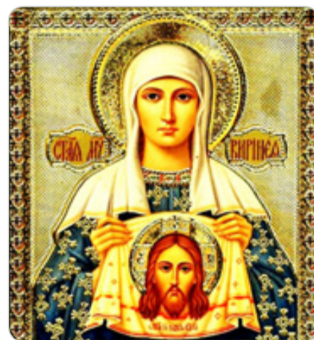
Кровителка на фотографията и фотографите.

Съгласно църковните предания, Вероника предложила на Исус въркан, за да изтрие лицето си, когато вървял по своя път към Голготата. На парчето тъкан се получило неръкотворно «истинско» изображение на образа на Спасителя. Образът и житието на Света Вероника са послужили за това да я приемат за по-