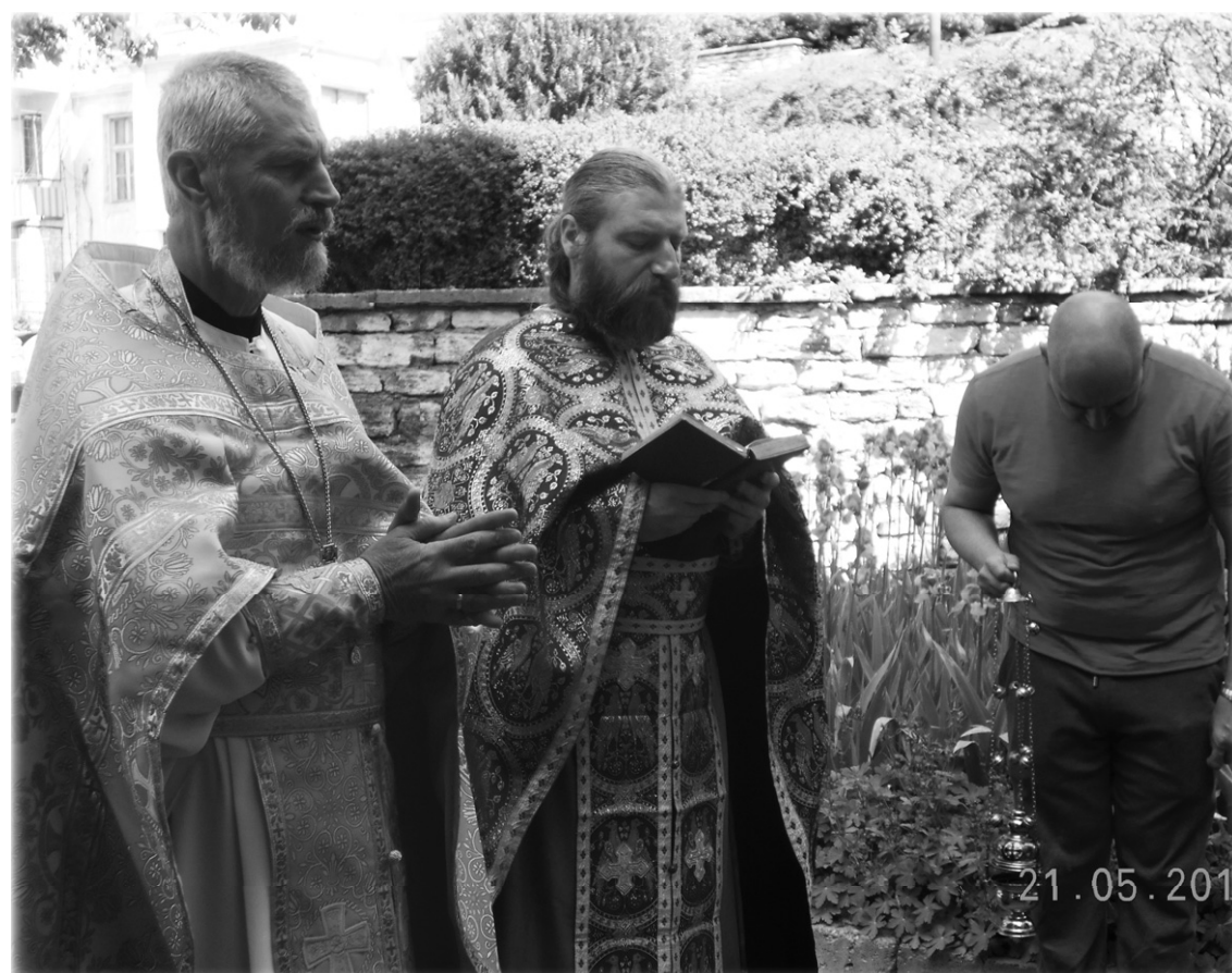
Тържествен водосвет в църквата „Св.Св.Константин и Елена“ Балчик по случай храмовия празник на 21 май.